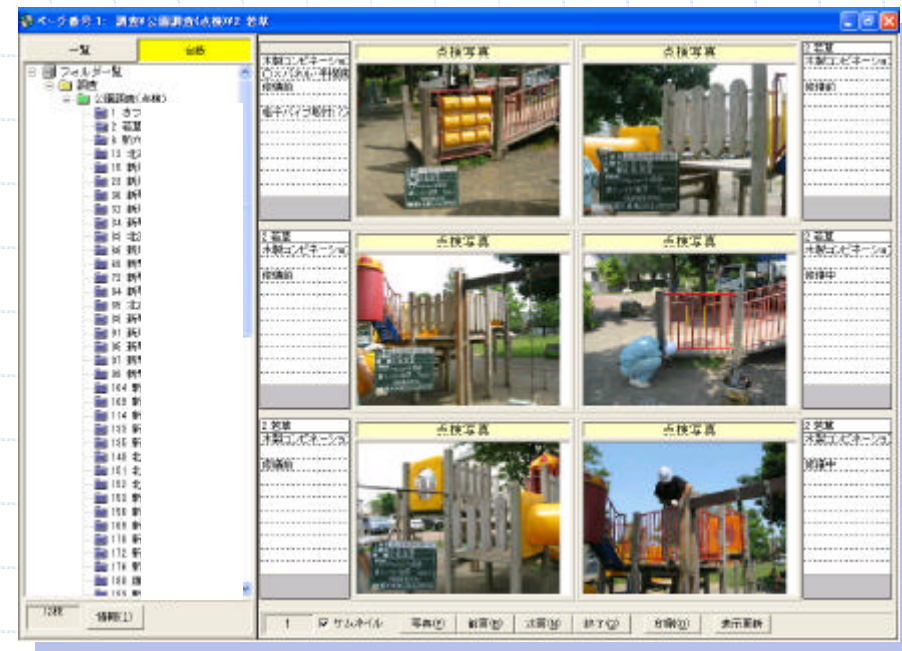
ビューアソフト表示例 (CD又はDVDにて納品)

写真データは、国土交通省の「デジタル写真管理情報基準(案)」に準拠しております。