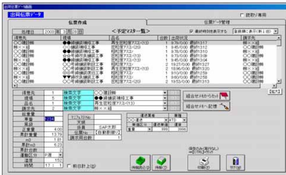
【伝票データ画面(伝票作成)】

得意先、現場名、品名を設定する時は、マスタNo(コード)で直接入力することも、検索キーを入力してヒットしたものから選択することも可能です。